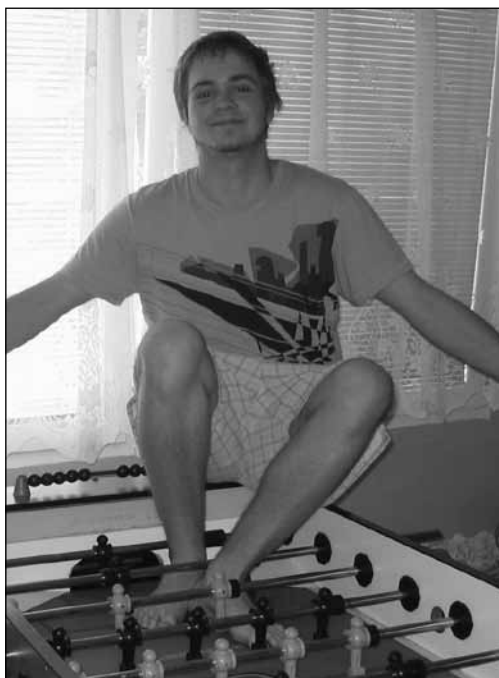
Se zapůjčeným stolem