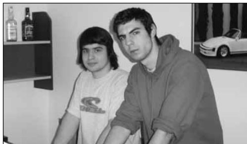
Its only game - část 2