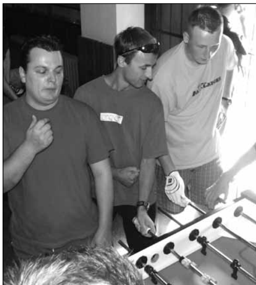
Část týmu V.A.B. – AM75

Zdravím všechny severomoravským fotbálekem zaujaté čtenáře. Opět je tady stručný přehled zpráv z okolí „srdce rudého“ a jeho fotbálového dění. V následujících řádcích probereme jak ligu, tak Ov poháry sezóny 08-09, nebo novinku v podobě nově otevřeného foosball clubu ve Frýdku-Místku.