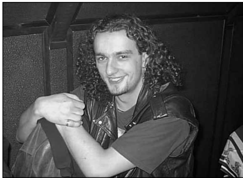
Bronzový Buben se za posledních 10let moc nezměnil