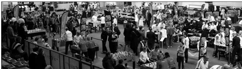
Hrací plocha ve francouzském Nantes