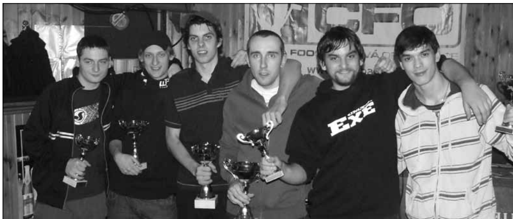
Nejllepší dvojice druhého dílu Českého poháru