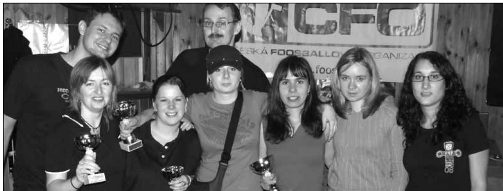
Tri nejženské dvojice druhého Českého poháru