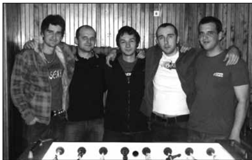
Nově zvolená Rada ČFO