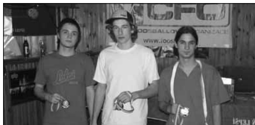
ČP II - juniorské jedničky

Na konec už zbývá jen poděkovat personálu restaurace Bristol za profesionálně odvedenou práci během celého vikendu.