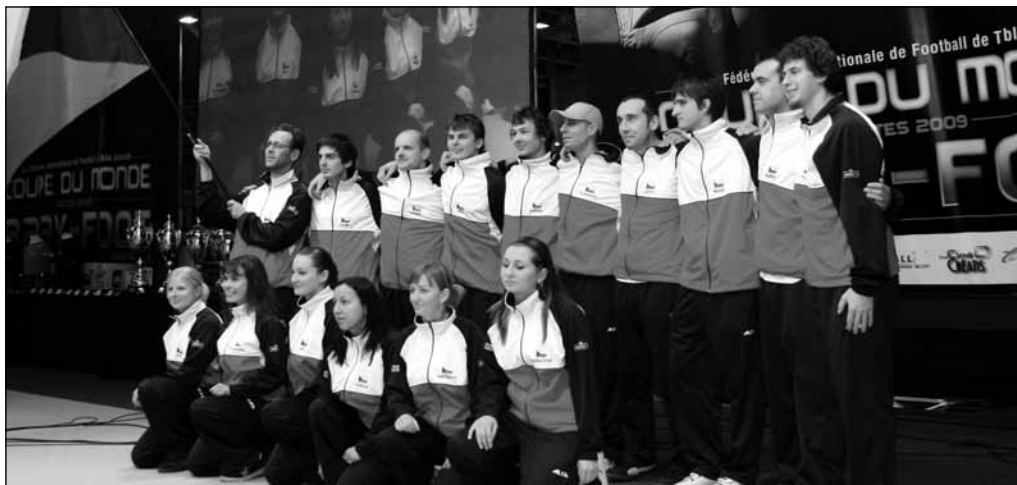
Česká reprezentace na Mistrovství světa v Nantes