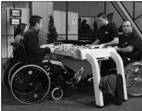
Letos poprvé byl součástí i turnaj pro vozíčkáře