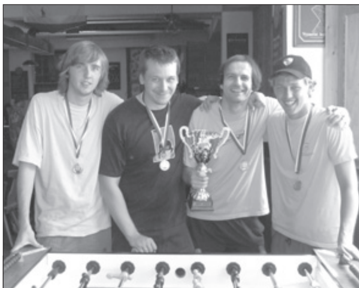
2. A liga, 1. místo - Rosengart B