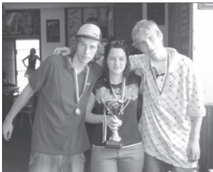
2. A liga, 2. místo - K.O. Mix