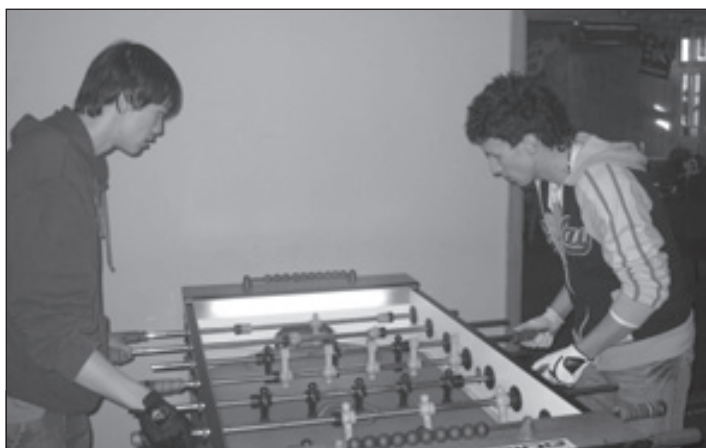
Hanz vs. Davos

Jinak se do soutěže (o nejlepší fotbálkáře) přihlásilo 22 dvojic a to ze všech možnejch světovejch