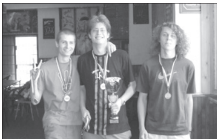
3. C liga, 1. místo - Sfumáti