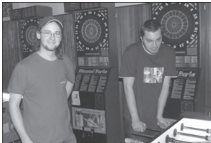
Na pražském poháru s Pavlem Čechem