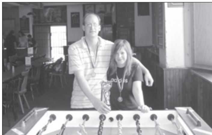
3. A liga, 3. místo - Bazmeg B