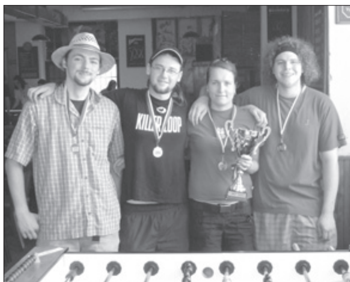
2. B liga, 1. místo - Krutý Krůty Crew