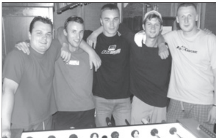
Vítěz ligy V.A.B. - AM75

Opět se hlásí Ostrava a s ní další novinky okolo dění ze světa fotbalkářů. Rosengart liga se vyvíjí prakticky podle očekávání (koho by napadlo, že budu mít pravdu), oproti minulému ročníku se změny budou hledat velice těžko, pokud se vůbec nějaké udály, proto se nebudu rozepisovat sáhodlouhými romány o tom, kdo směřuje k titulu a kdo ne.