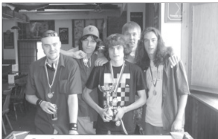
1. B divize, 2. místo - BAMBOo CLAN B