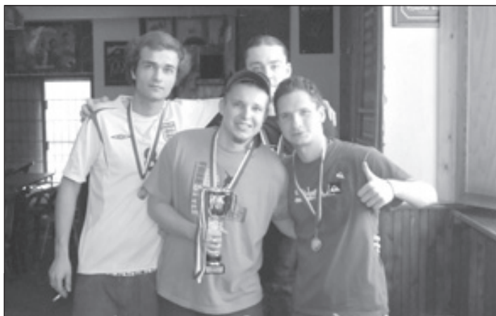
3. C liga, 2. místo - Grande Zero