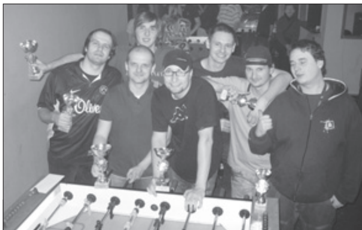
Bedna dvojice: Pyžmoň - Rejža (2.), Lavi - Lukyn (1.), (Klimplos), Sepultura - Tomba (3.)

V sobotu 16. února se konal další MP - HalloPizza cup, a to již takřka pravidelně v novém prostředí kterým je mostecký Bristol. Všichni tam už trefíte, tak je to moc fajn, jen s tím časem je to pořád bídny. I když kucí z Bíliny tentokrát přijeli