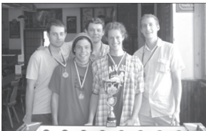
3. B liga, 1. místo - SMOT 00