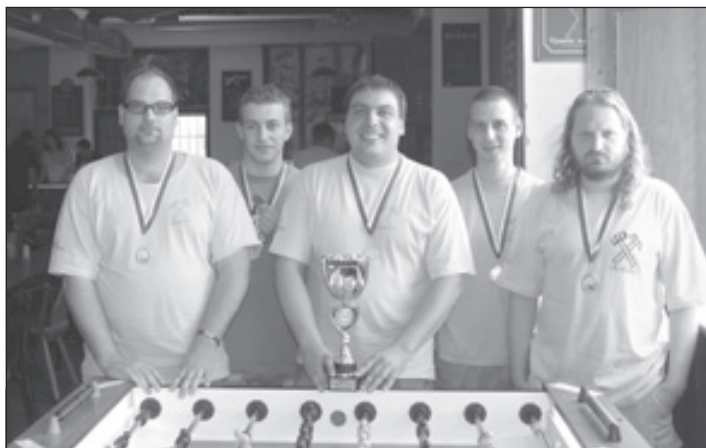
3. A liga, 1. místo - Uraňáci