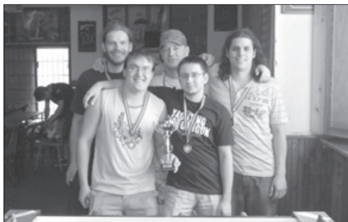
1. B divize, 3. místo - Balls of Steel