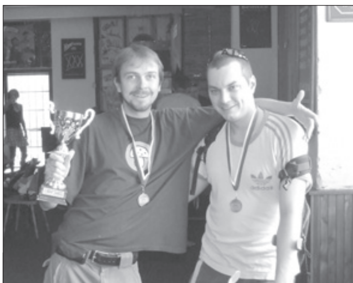
2. A liga, 3. místo - BAMBOo CLAN