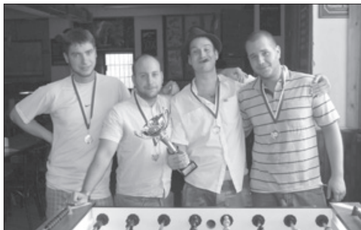
1. A divize, 1. místo - VIDLAGANG